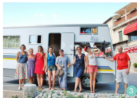
Tournée générale - Lanas

Après un premier test de dispositif qui a mis à l'épreuve des villes et villages traversés le concept d' acupuncture urbaine , ( Tournée générale ! , parcours en région Auvergne-Rhône-Alpes ponctué de rencontres, de diffusion culturelle et de captation d'expériences), Carton plein souhaite amplifier les scénarios de cette forme mobile d'intervention (écriture, scénographie, création de personnages, tests d'outils, etc.).