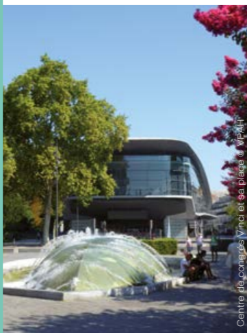
Centre des congrès Vinci et ses places à Tours

La production tourangelle s'illustre à travers des édifices publics, des demeures privées ou encore des œuvres monumentales. Cette visite est l'occasion d'évoquer un patrimoine en construction et de mettre en lumière des chantiers d'actualité.