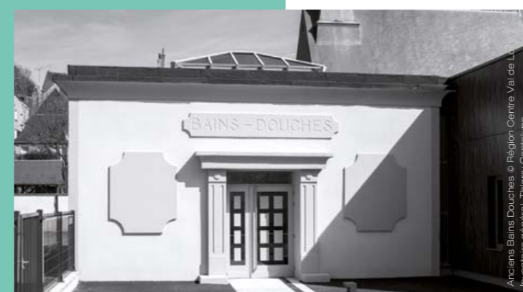
Anciens Bains Douches