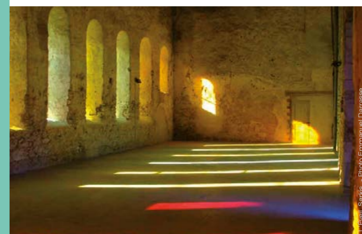
L. Esail, Sarkis

■ dimanche 21 octobre 11h visite commentée conduite par le propriétaire visite gratuite sur réservation : caue37@caue37.fr - 02 47 31 13 40 → Prieuré de Saint Jean du Grais, 37270 Azay-sur-Cher