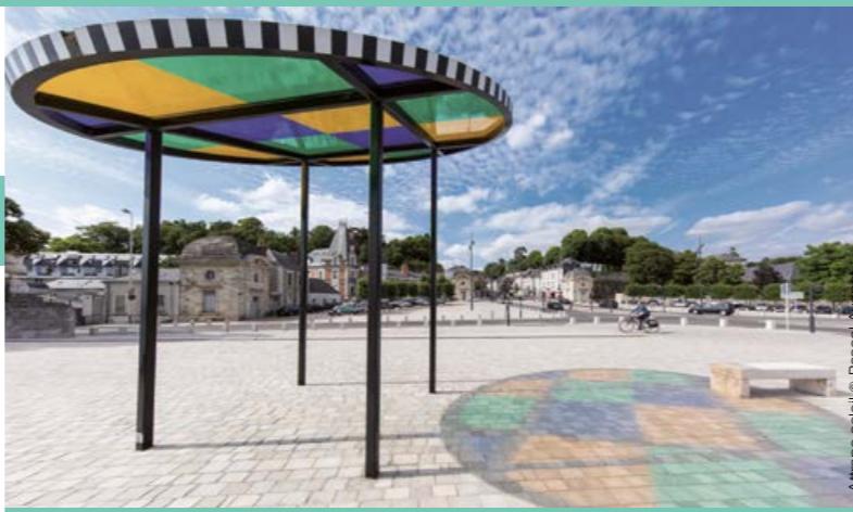
Attrape soleil

■ Vendredi 19 octobre 17h visite commentée par le responsable du Prieuré, coordinateur du projet. durée : 40mn droit d'entrée du monument renseignements 02 47 37 32 70 → Prieuré Saint-Cosme, demeure de Ronsard 37520 La Riche