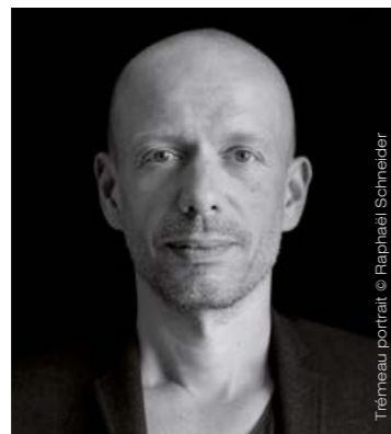
Trémeau portrait

Tristan TRÉMEAU est docteur en histoire de l'art, critique d'art, commissaire d'exposition, professeur à l'Esad TALM-Tours et à l'Académie royale des Beaux-Arts de Bruxelles. Auteur de nombreux articles pour la presse artistique depuis les années 1990 ( Artpress , Art 21 , L'art même ), il a publié In art we trust. L'art au risque de son économie (éd. Al Dante, 2011) et prépare un nouveau livre sur la place de l'art et des artistes dans les politiques urbaines.