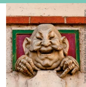
Terre d'Art Nouveau

deux visites éclair conduites par un guide-conférencier du Pays d'art et d'histoire Loire Touraine inscription obligatoire - places limitées : Pays Loire Touraine - 02 47 57 30 83 gratuit - durée de chaque visite : 30 min départ : Place Courtemanche (devant l'Office de Tourisme)