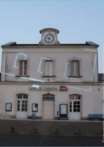
Équipement, François Morellet

Retour sur la genèse du projet de création de quatorze vitraux par le grand peintre franco-chinois Zao Wou-Ki pour les baies du réfectoire roman des moines du Prieuré Saint-Cosme en 2010.