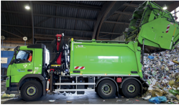
Photographies issues du travail de terrain