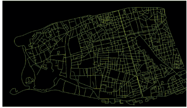
Les trajets des ripeurs dessinent la Métropole de Tours