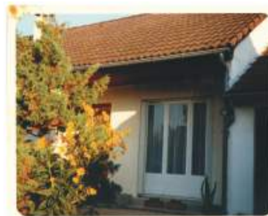
Rue du Prieuré de l'Encloître, photographie | Vers 1985

Le carrelage est constitué de petits carreaux de 1 x 1 cm, dans les tons bordeaux-rouge-brun-violet. Quand on marche pieds nus dessus, on sent les joints qui accrochent un peu la plante des pieds. Ce carrelage est continu dans l'entrée, le couloir et la cuisine, mais des barres de seuil vissées marquent tout de même les différents espaces. La porte de droite qui mène à la salle à manger, directement depuis l'entrée, est condamnée. Derrière elle, il y a un meuble à portes vitrées, sur lequel est posé le téléphone. On entre donc par le salon, en face de la porte d'entrée. La salle (comme on l'appelle en Normandie, sans distinction entre salon et salle à manger), est une grande pièce traversante. Les portes-fenêtres qui donnent sur l'arrière laissent voir la terrasse entourée de haies touffues de troènes. Les trois portes-fenêtres d'en face, qui donnent sur le jardin de devant et la rue, sont occultées par des voilages blancs légers. Comme c'est la façade qui est exposée au sud, le soleil se diffuse dans ces voilages, et on suit toute la journée au sol le trajet elliptique des trois rectangles de lumière sur le lino blanc-crème tacheté. Une très longue table de bois de plus de trois mètres et ses deux bancs traversent toute la pièce en longueur.