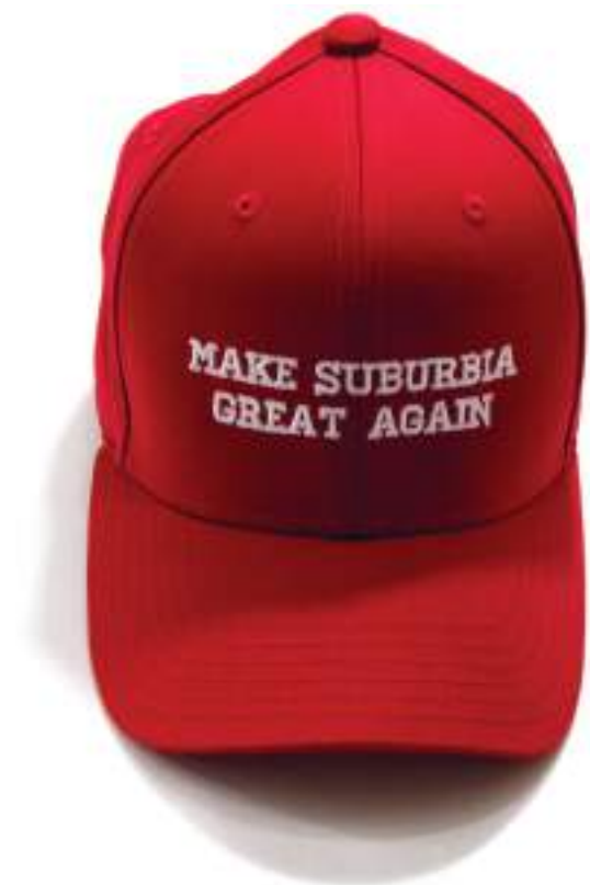
Make Suburbia great again , casquette brodée, édition de trois | 2019