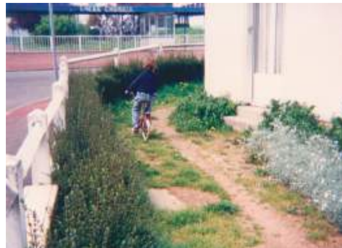
Ligne de désir , photographie | Vers 1988

Par exemple, l'ensemble « ciel bleu - cerisier - antenne Cibie sur le pignon d'un pavillon - avion à réaction ». Ou encore « haie - bordure de trottoir - hangar à l'horizon, entre deux maisons toutes proches ».