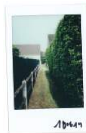
Chemin , Polaroid | 2019