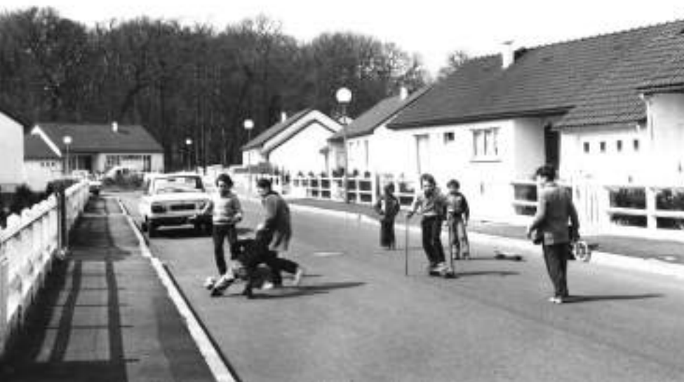
ZAC des Douets | 1983

Le parc de la Cousinerie , réalisé plusieurs années après notre départ du quartier, est un bon prétexte pour nous y rendre, mes parents, mon frère et moi, dès que je rentre à Tours. La balade agréable que nous y faisons comme un rituel nous permet d'abord de passer devant notre maison, de descendre notre rue, et de refaire le trajet de l'école, sans trop savoir pourquoi. Il se joue dans cette litanie familiale beaucoup de choses.