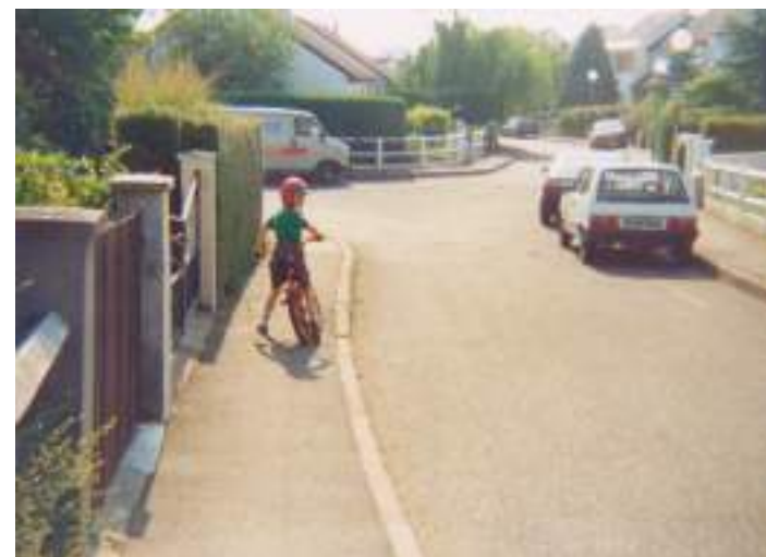
Rue du Prieuré de l'Enclôître , photographie | Vers 1990

Comment rendre compte de ces formes de vies périurbaines sans utiliser de statistiques, sans parler de politique, sans vocabulaire technicien et en détournant les pièges des classifications réductrices ? Comment le regard du poète peut compléter celui de l'architecte pour saisir « la complexité d'une vie de famille dans une forme minimale pavillonnaire » et transmettre l'« intensité de vie » propre au périurbain ?