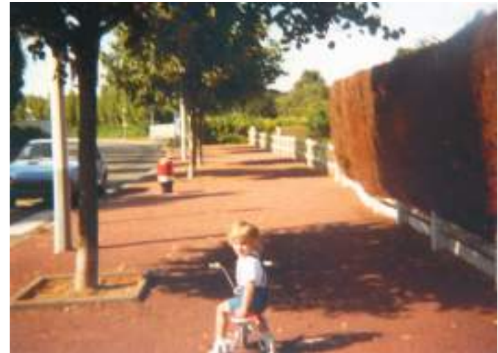
Rue des Douets, photographie | Vers 1985