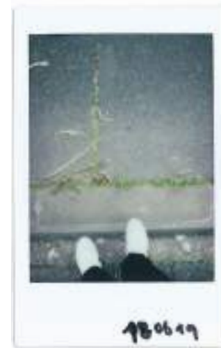
Rue de la Chatonnière, Polaroid | 2019

Je la raccompagne chez elle, rue d'Argenson, en sortant du collège. Nous sommes en sixième. Au moment de la quitter, je ne l'embrasse pas. Trop impressionnant pour moi. Il faut trouver dans cette situation embarrassante (face à face, rue de la Chatonnière, elle sur la route, moi sur le trottoir), une manière de tourner les talons, après avoir regardé mes pieds. Je marche, me retourne après quelques mètres, et la vois tourner sur la gauche, en sachant au fond de moi que je manque quelque chose, et que c'est déjà fini.