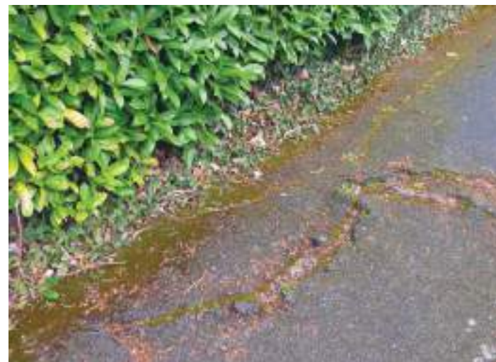
Racines , photographie | 2019

Je passe à côté du cerisier dont les branches surplombent le virage de la rue Fontaine-les-Blanches. Traverser ce carrefour m'a toujours plu. Les racines des arbres devenus imposants dans les jardins déforment les trottoirs. Il y a des bosses et des craquelures dans le goudron.