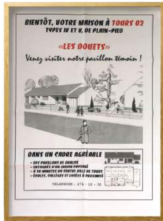
Pavillon témoin, affiche tirée à cinq exemplaires (70 x 50 cm) | 2018