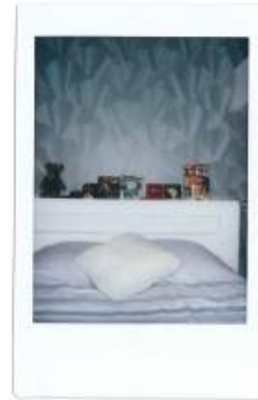
Quelques objets (peluches, dévidoir à ruban adhésif, disques compacts, disque vinyle, magazine, aimants), Polaroid | 2019

Le lendemain, avant de repartir, j'entre dans ce qui était ma chambre, le cœur lent, et je dépose sur le coin du bureau l'album White Pony , le dernier objet ayant occupé celle-ci, le 21 juin 2000, à peu près à l'endroit où se situait mon lecteur Cd. C'est un geste très doux et plein de tendresse. Tout est maintenant à sa place.