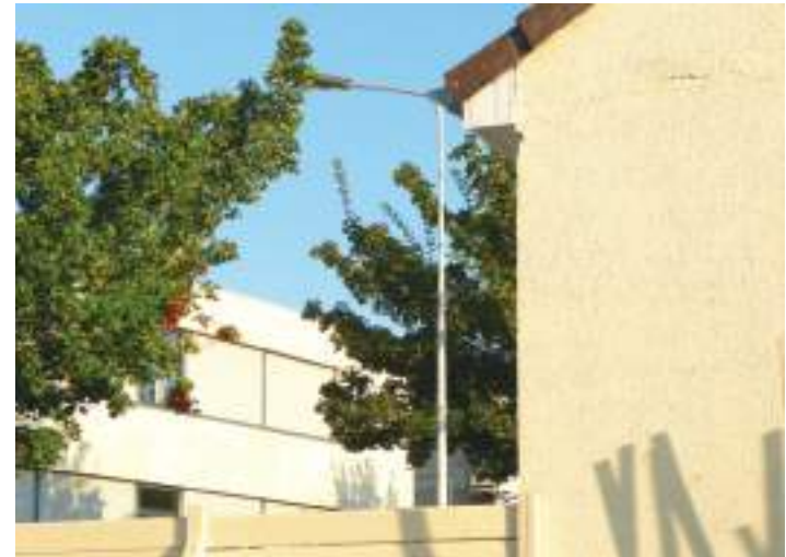
Signes, photographie | 2019

Quand j'ai les moyens de m'acheter un MiniDisc , j'enregistre mes premières « compositions », en faisant du bricolage en multipistes. C'est archaïque et laborieux, mais ça fonctionne bien avec la belle lumière de fin de journée qui entre par la fenêtre de ma chambre. Durant cette période, je suis heureux à plein temps.