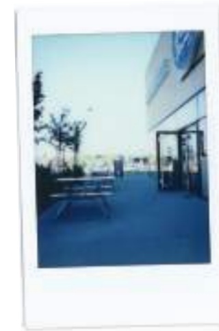
Marie Blachère , Polaroid | 2019

21 juin 2019. Dernier jour de résidence. J'ouvre les volets « accordéon » en PVC de ma petite chambre pour la dernière fois. Je prépare mes affaires et quitte la maison, non sans ressentir un pincement au coeur. C'est en quelque sorte le simulacre qui rejoue l'arrachement d'il y a presque 20 ans. Je me dirige vers Auchan Saint-Cyr, et prends un petit déjeuner sur la « terrasse » de la « boulangerie » industrielle Marie Blachère . Un café allongé et un pain au chocolat sur ce semi-parking me semblent très bien pour clore cette semaine de résidence suburbaine. Je vois de l'autre côté de la rue, sur ma droite, l'emplacement du parking d' Auchan sur lequel nous nous sommes garés presque tous les samedis matin avec mes parents et Charles. Autrefois, la grande surface était un Super M . Nous allions fréquemment le soir à la cafétéria, qui se situait à l'autre bout de la galerie marchande. En face de moi, la circulation est déjà dense sur le Boulevard Charles-de-Gaulle. Il y a toujours ce vent frais, comme un compagnon. C'est une tristesse rassurante qui s'empare de moi.