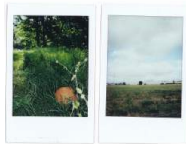
You can't go home again , Polaroids | 2019

On prend vite des habitudes. Assis sur un banc au milieu de la galerie, j'entends le son du fer à repasser du pressing qui est à quelques mètres. Petit à petit, les rideaux métalliques ouvrent dans les différentes enseignes ( Okaïdi , Body minute , Camaïeu ...). La porte automatique séparant la galerie du parking s'ouvre et se ferme en émettant un bruit de frottement. Au bout du banc sur lequel je suis assis, une fille et sa mère se chamaillent à propos du fonctionnement du portable de la mère.