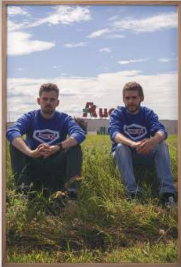
The pirlgrims , photographie, 137 x 92 cm | 2016