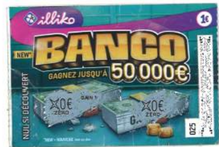
Ticket perdant, jeu Banco de la Française des Jeux | 2019

Je ne suis vraiment pas un tough guy , mais ça me va.