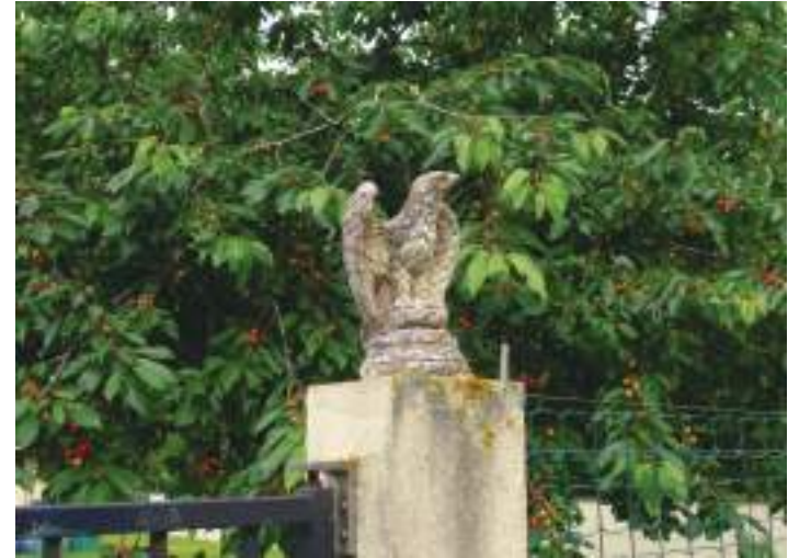
Gardien , photographie, 2019