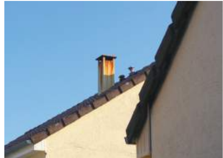
Signes , photographie | 2019

La pente devant le lycée coule sur la rue des Douets, qui descend elle-même vers le sud du quartier. J'aime cette topographie qui multiplie les points de vue dans cette grande ligne droite. Nous nous amusons à sauter par dessus les lettres démesurément longues du mot « ECOLE » avec nos skates ou en BMX. L'été, il fait parfois tellement chaud qu'on peut déformer ces lettres en les poussant avec nos pieds. Elles glissent mollement dans leur écrin de goudron fondu.