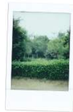
Groiseilles , Polaroid | 2019